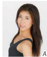
有水 梓 「沈黙の春」